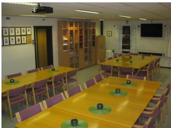
Slik ser foreningslokalet ut