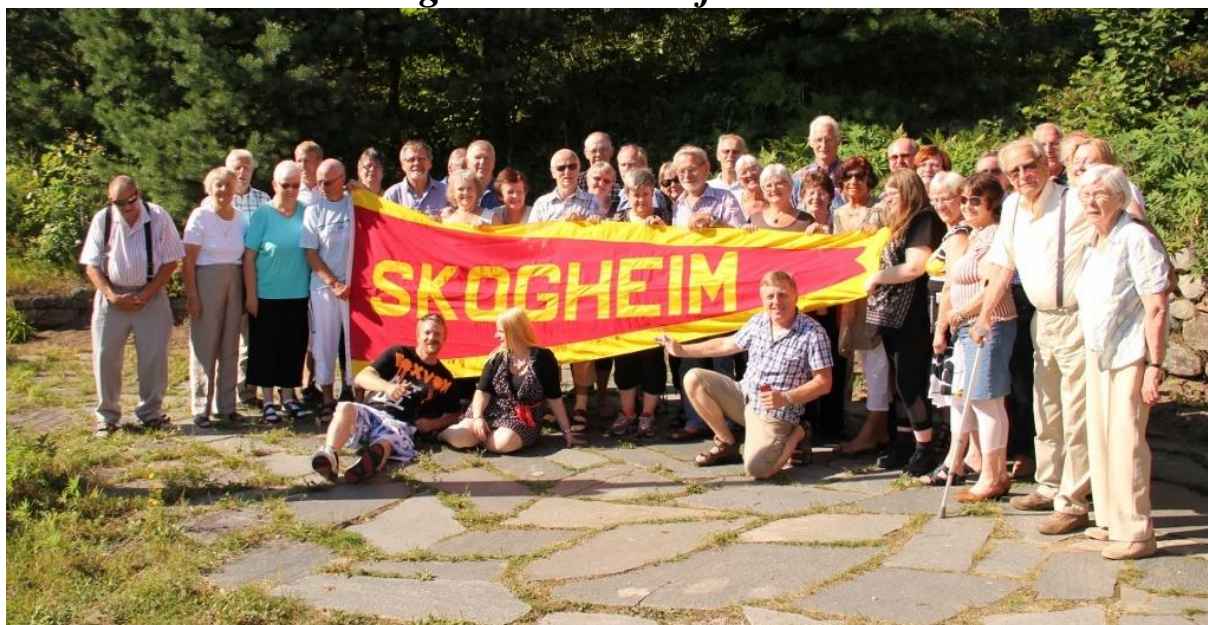
Gruppebilde med gaven fra Drammen Døveforening mellom seg.