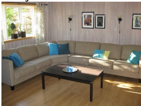
Kjellerstuen i hovedhytta