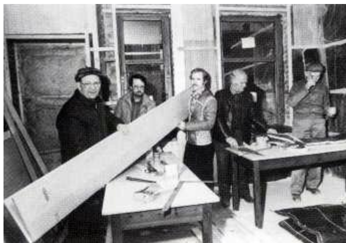
Der drives dugnad på det nye døvesenteret.

Den 8/10-1977 ble det innkalt til ekstraordinært årsmøte hvor saken om kjøp av hus i Treschowsgt. 9 sto på dagsordenen.