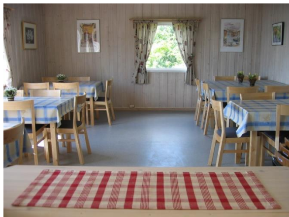
Dagligstua i hovedhytta