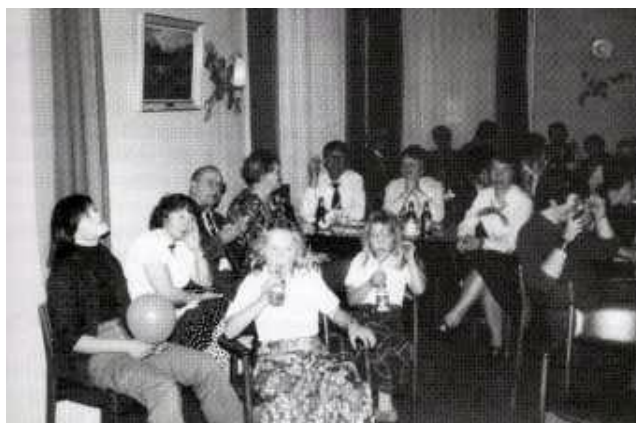
Foreningslivet i Hauges gt. 99.