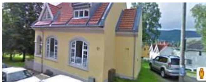
Slik ser Haugesgt. 99 ut i dag.