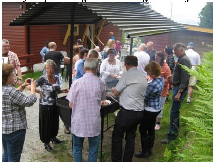
Hele 64 personer deltok på festen.