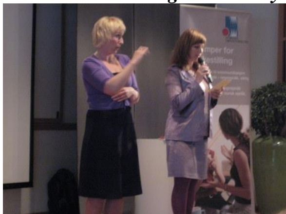
Prinsesse Martha Louise talte og fremførte en hilsen til NDF