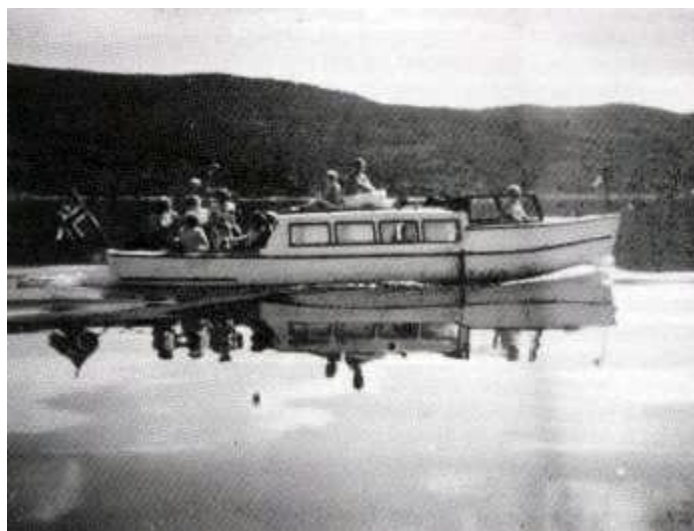
Motorbåten «Syvern» (7 eiere) var en populær båt som ble brukt til fisketurer og transport av materialer og medlemmer til feriehjemmet.

Drammen og Omegns Døveforening innvidde søndag 3. august sitt nye feriehjem «Skogheim». Innvielsesfestlighetene ble begunstiget med et strålende vær, og med flagget til topps ønsket feriehjemmet de 65 innbudte gjester velkommen. Alle de tilstedeværende var fylt av beundring over det vakre feriehjemmet som døveforeningens medlemmer hadde reist. Middagen besto av fiskepudding med rekesaus og is til dessert.