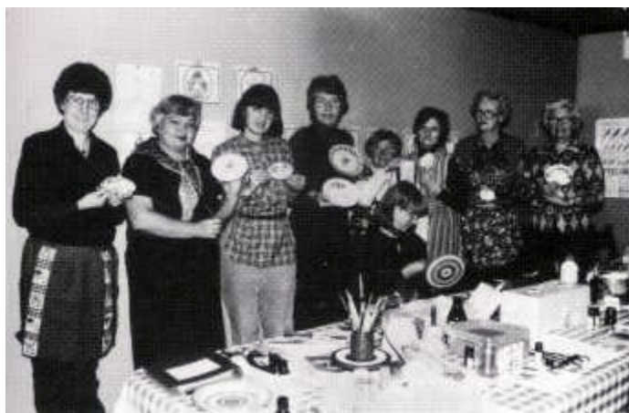
Porselensmaling er populær form for kursaktivitet.

De ulike kurs dreiet seg om opplæring til tegnspråklærere, dramakurs, organisasjonskurs, fotokurs, filmkurs, pensjonistkurs, porselenskurs m.m.