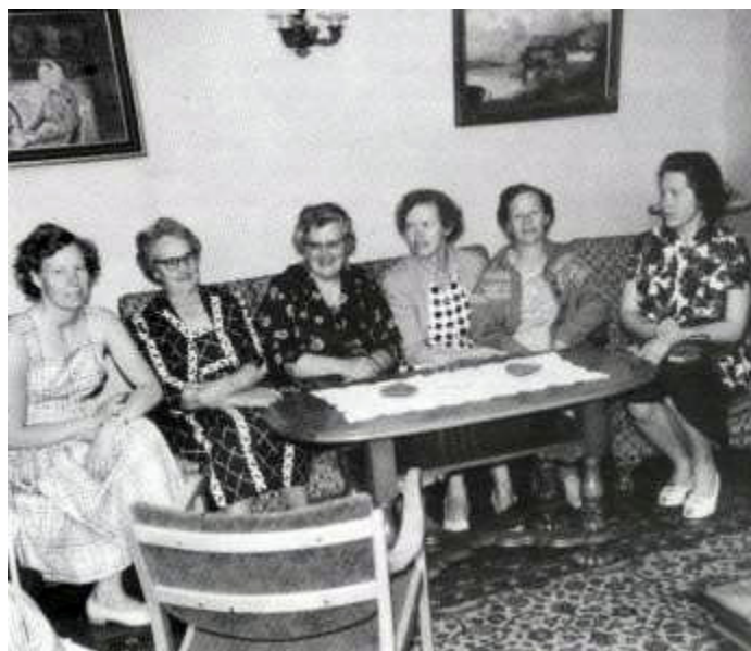
Kvinneforeningens medlemmer på husmorferie.

En Kvinneforening så også dagens lys og gjorde en fin innsats, blant annet skaffet den tilveie nye møbler til foreningens feriehjem, arrangerte husmorferier og skaffet penger tilveie ved loppemarkeder og utlodninger.