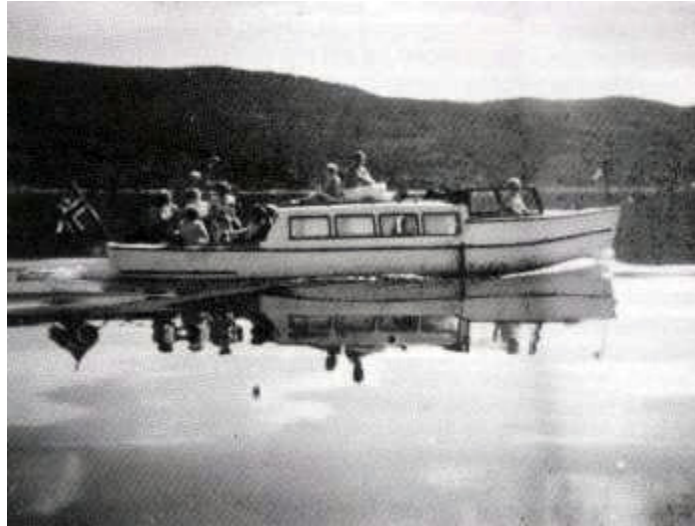
Motorbåten «Syrern» var en populær båt som ble brukt til fisketurer, og transport av materialer og medlemmer til feriehjemmet.

Mange medlemmer har hatt ansvaret for feriehjemmet gjennom tidene og man har skiftet på vaktholdet der ute, og medlemmene har gjort sitt beste for å holde dette vakre feriestedet så pent som mulig. Eiendommen er på ca 6 mål og består av en 2 etasjes hovedbygning, 3 familiehus med til sammen 30 sengeplasser. En lekeplass og frukthage samt parkeringsplass. Dessuten er det et stort redskapshus og et friluftskjøkken. Et fint anlegg som Drammen Døveforening kan være glad for å ha i sitt eie.