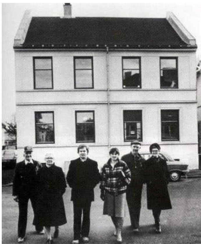
Eldre og unge medlemmer gleder seg til å flytte inn i eget hus!