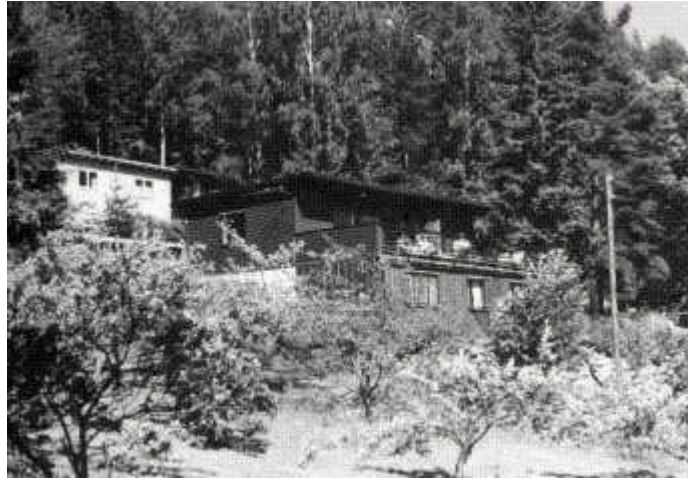
Drammen Døveforenings stolthet. «Feriehjemmet Skogheim», bygget av foreningens medlemmer.