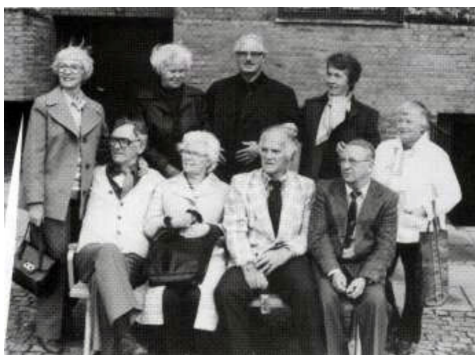
Pensjonister og pensjonister «In Spe» på hyggetur i Danmark.