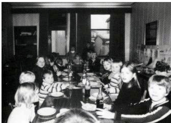
«Barneåret» feires med fest i Døveforeningen for døve og hørende barn.