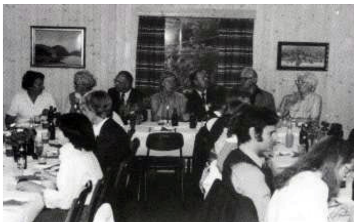
Skogheim feirer 40 års jubileum med fest på feriehjemmet.