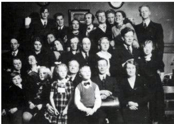
De første årene samledes medlemmene i private hjem. Dette bilde er fra krigsåret 1940