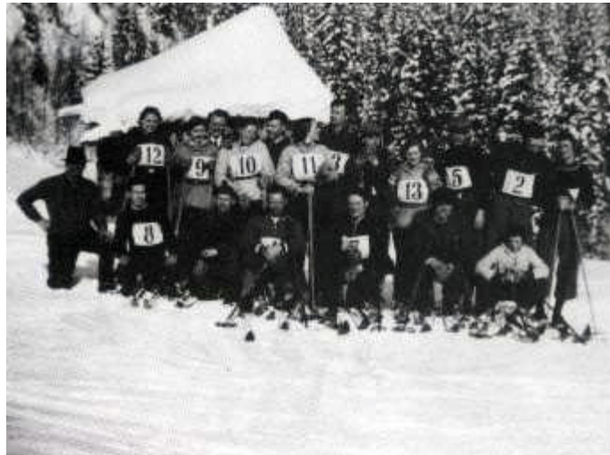
Det første skirenn ble holdt i Lier vinteren 1933.