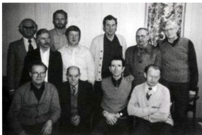
Bridgeklubbens medlemmer samlet ved 25 års jubileet.