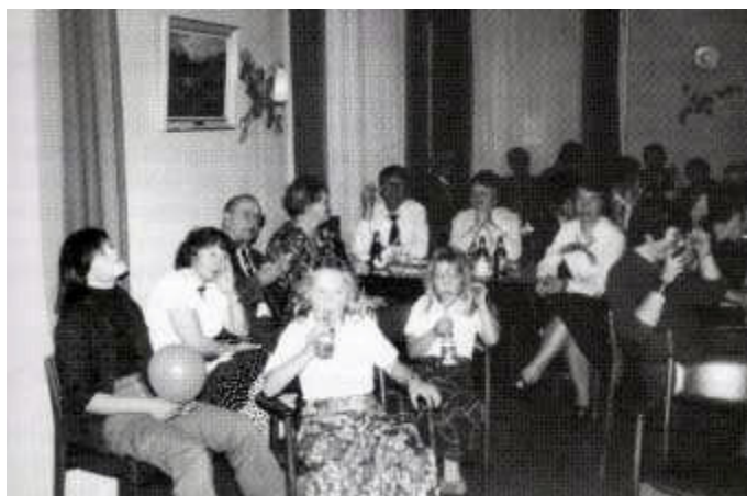
Foreningsliv i leid hus i Hauges gt. 99.