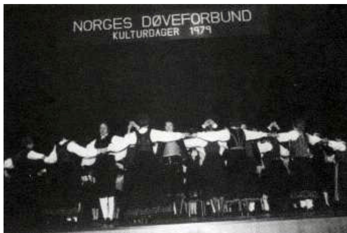
Folkedans er en fin kulturaktivitet.