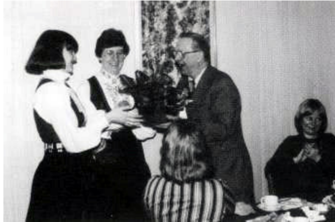
Kvinneforeningen overrekker blomster til byggekomiteens formann