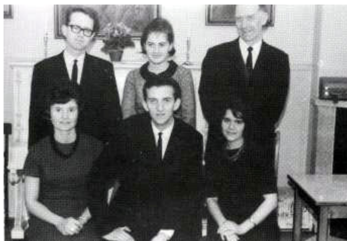
Ungdomsklubbens første styre:

I årenes løp har disse underavdelingene bidratt til å sette farge på foreningslivet og gitt aktivitetstilbud til vare medlemmer.